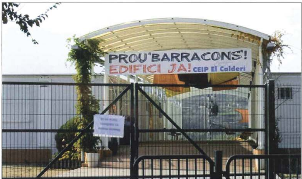
L'escola El Calderí funciona des de l'any 2006 en mòduls prefabricats. Actualment compta amb vuit mòduls que acullen 272 alumnes.