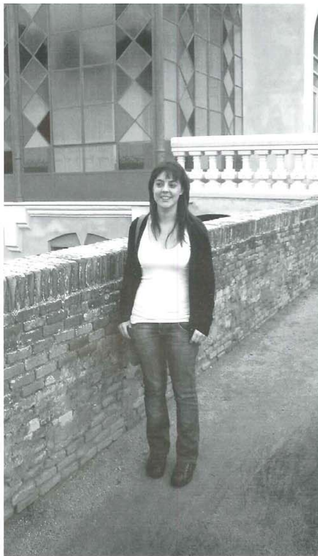
La jove arquitecte davant d'uns dels edificis que més l'agrada de Caldes, l'Espai Can Rius

L'objectiu de la Càtedra és la sensibilització mediambiental del sector de la edificació definint unes noves pautes en: les seves actituds,